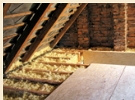
Nová podlaha vytvořená Stropním Systémem MAGMARELAX® po částečném uzavření