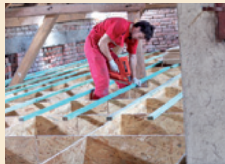
Příprava montované podlahy Stropním Systémem MAGMARELAX®